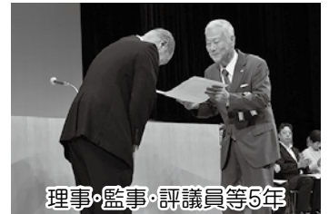
理事・監事・評議員等5年