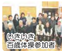
いきいき 百歳体操参加者