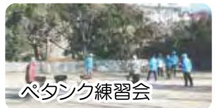
バドミントン練習会

人生100歳以上生きること目標にしようすれば良いか研修等で色々教わり、何もしなければ、体の部位は衰えるばかりです。 第二に脳を鍛えること、すべての運動をやることで、記憶力が良くなり、認知症の進行を防ぐことになる脳トレーニングです。 当地域での試みとして、以前12年前から月々土間でやっている「早起きラジオ体操」、広島市よりポイント手帳をもとに金額の援助があり好評です。 「いきいき百歳体操」は、西区シニアクラブ25単位クラブがカーブOB選手によるDVDを4回実施し、声を出して体を動かしています。