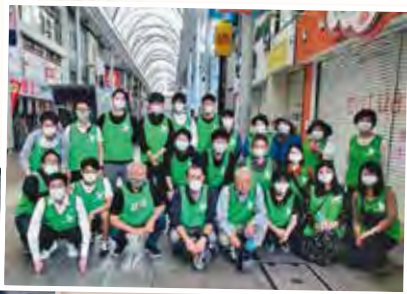
◀皆実町6丁目老人会「平和会」施設見学