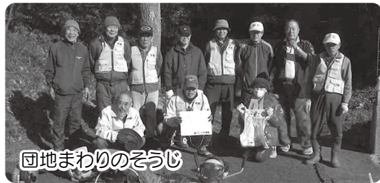
団地まわりのそうじ

師をお招きし講演をいただいた り、区連協の会長からのお話を いただいたり、看護師から脳の 活性のため機能を刺激する体操 を指導していただき、多種多様 に皆さま方からご協力をいただ き、楽しくやっています。