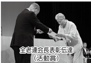
全老連会長表彰伝達 (活動賞)