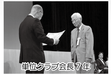
単位クラブ会長7年