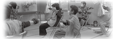
定期的に(月1回)、 ひろしまGENKI体操を開催します

5人以上集まって活動されている場所へ、毎週、同じ曜日、同じ時間にお届けします。[※配達手数料 無料 ※体操トレーナー派遣 無料] まずはお気軽に、下記までお問い合わせください。お待ちしております！