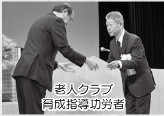
老人クラブ 育成指導功労者