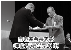
市老連会長表彰 (単位クラブ会長20年)