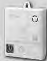
電池式ガス警報器

ガス漏れ、不完全 燃焼による一酸化 炭素を検知する と、ランプと音声で お知らせします！